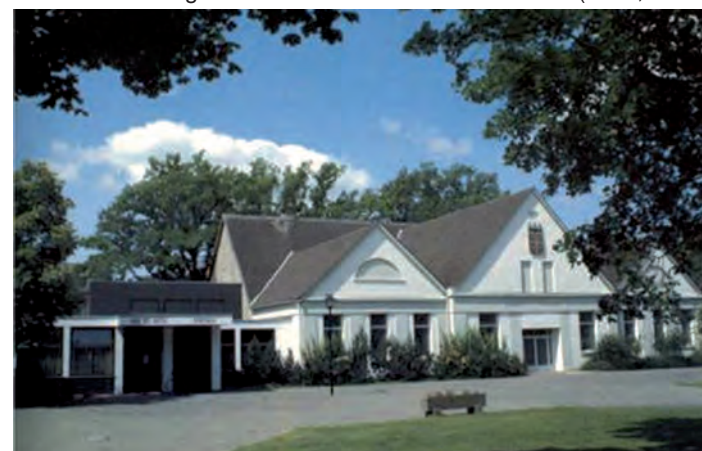
Die Zukunft der Stadthalle Nieheim steht auf der Tagesordnung.